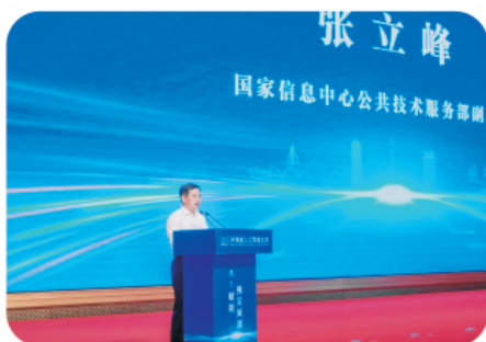
省发展改革委党组成员、副主任万战伟