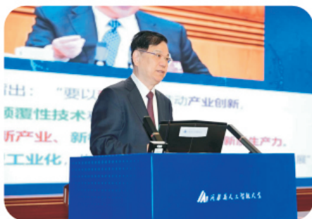
科学技术部原副部长、十一届全国人大教科文卫委员会委员吴忠泽