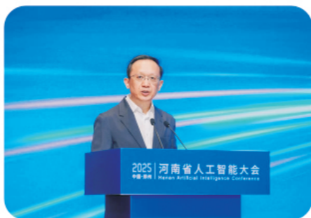
省政府副省长李涛出席开幕式并致辞