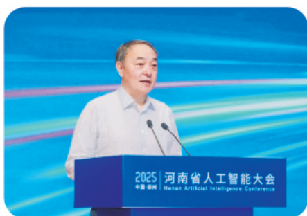
省发展改革委党组书记、主任马健主持开幕式